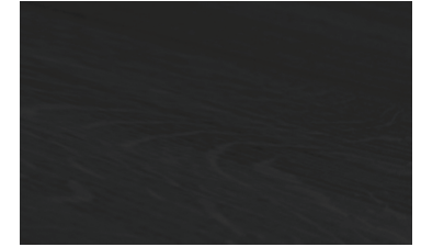
Black dyeing of OAK

オーク材特有の美しく力強い木目はそのままに、深い黒に染め上げた黒染加工です。木材に含まれるタンニン成分と酸化鉄の溶液を反応させて染める昔ながらの技法で、塗装とは違い木目をしっかり残したまま染まるのが特徴です。化学染料を一切使用しない安全な染色技法です。シックでスタイリッシュな雰囲気がインテリアをグッと引き締めてくれます。